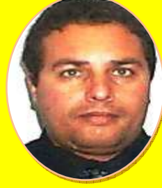
HALYM Mhamed Bagagiste/DOS Hub Med V